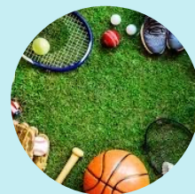
Mozgásfejlesztés Szakmai Centrum tagja