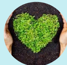
Újbuda környezettudatos óvodája program tagja

Szeretettel várjuk, a hozzánk jelentkező gyermekeket!